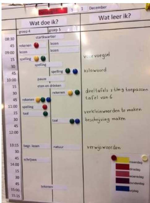
Voorbeeld bord combinatiegroep

Op het dagbord staat een overzicht van de instructiemomenten en activiteiten die op die dag voorbijkomen. Achter de kernvakken staan daarnaast de doelen vermeld, zodat de kinderen weten wat ze leren. Door het gebruik van het dagbord kunnen de kinderen zelfstandig zien wanneer ze klaar moeten zitten voor een instructie/les. De gekleurde magneten geven aan voor welke niveaugroep de instructie is.